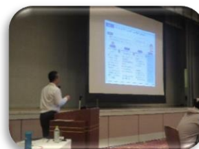
午後の部 ナビゲーションブック についての講義