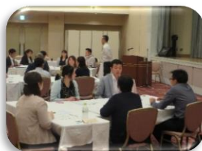
午前の部 グループワークの様子